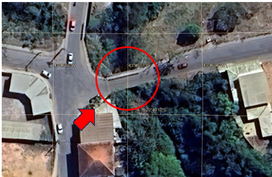
Imagem 1: Vista de Satélite Fonte: Google Earth (2025).