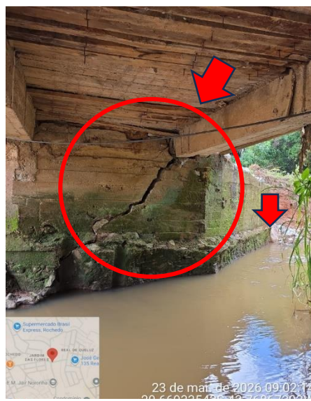
Figura 6: Destacamento estrutural Fonte: Autor (2026).

Tal manifestação configura um quadro de elevada criticidade, uma vez que promove a redução da área efetiva de contato entre a fundação e o maciço de suporte, implicando na redistribuição desfavorável de tensões e no aumento das solicitações atuantes. Como consequência, há comprometimento direto da capacidade de carga e da estabilidade global do sistema favorecendo a ocorrência de recalques diferenciais, rotações excessivas e deslocamentos horizontais.