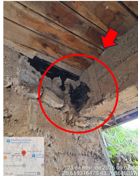
Figura 5: Esforços de cisalhamento

De forma concomitante, constatou-se a ocorrência de solapamento da fundação, caracterizado pelo fenômeno de scour hidráulico, conforme evidenciado na Figura 6. Observa-se a erosão progressiva do material de apoio, com carreamento de finos e consequente formação de vazios na interface solo-estrutura, indicando perda de confinamento lateral e degradação das condições de suporte.