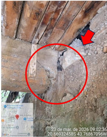
Figura 4: Esforços de cisalhamento