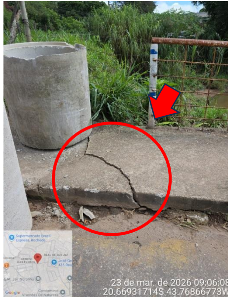
Figura 8: Fissura resultante de esforços secundários