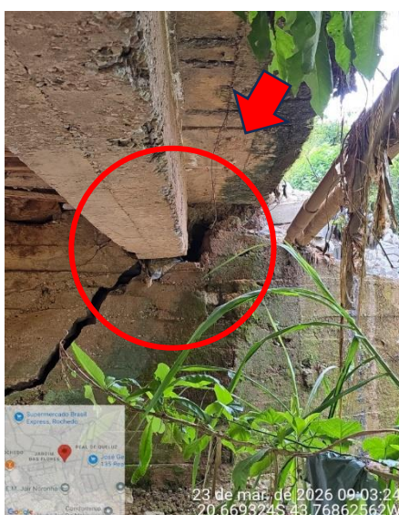
Figura 7: Fissura resultante de esforços diferenciais

Essa anomalia interfere diretamente no mecanismo de transferência de esforços verticais e horizontais, podendo resultar em redistribuições não previstas, com concentração de tensões em regiões específicas do tabuleiro e dos apoios. Como consequência, há incremento das solicitações locais, potencializando a ocorrência de fissuração adicional, esmagamento de materiais de apoio e até a instabilidade dos elementos estruturais adjacentes (Figura 7).