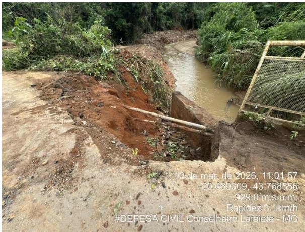
Figura 2: Carreamento de material