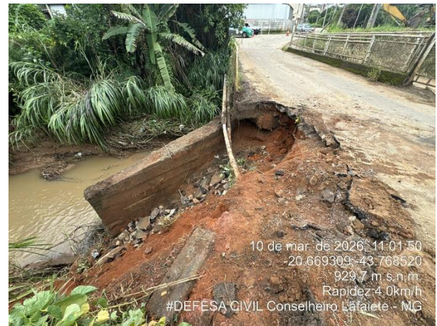
Figura 3: Carreamento de material

A estrutura da ponte apresenta manifestações patológicas graves e interdependentes que, analisadas de forma integrada, caracterizam um quadro avançado de deterioração estrutural. Essas anomalias comprometem o desempenho dos elementos resistentes, afetando a capacidade portante, a rigidez global e a estabilidade, configurando uma condição crítica.