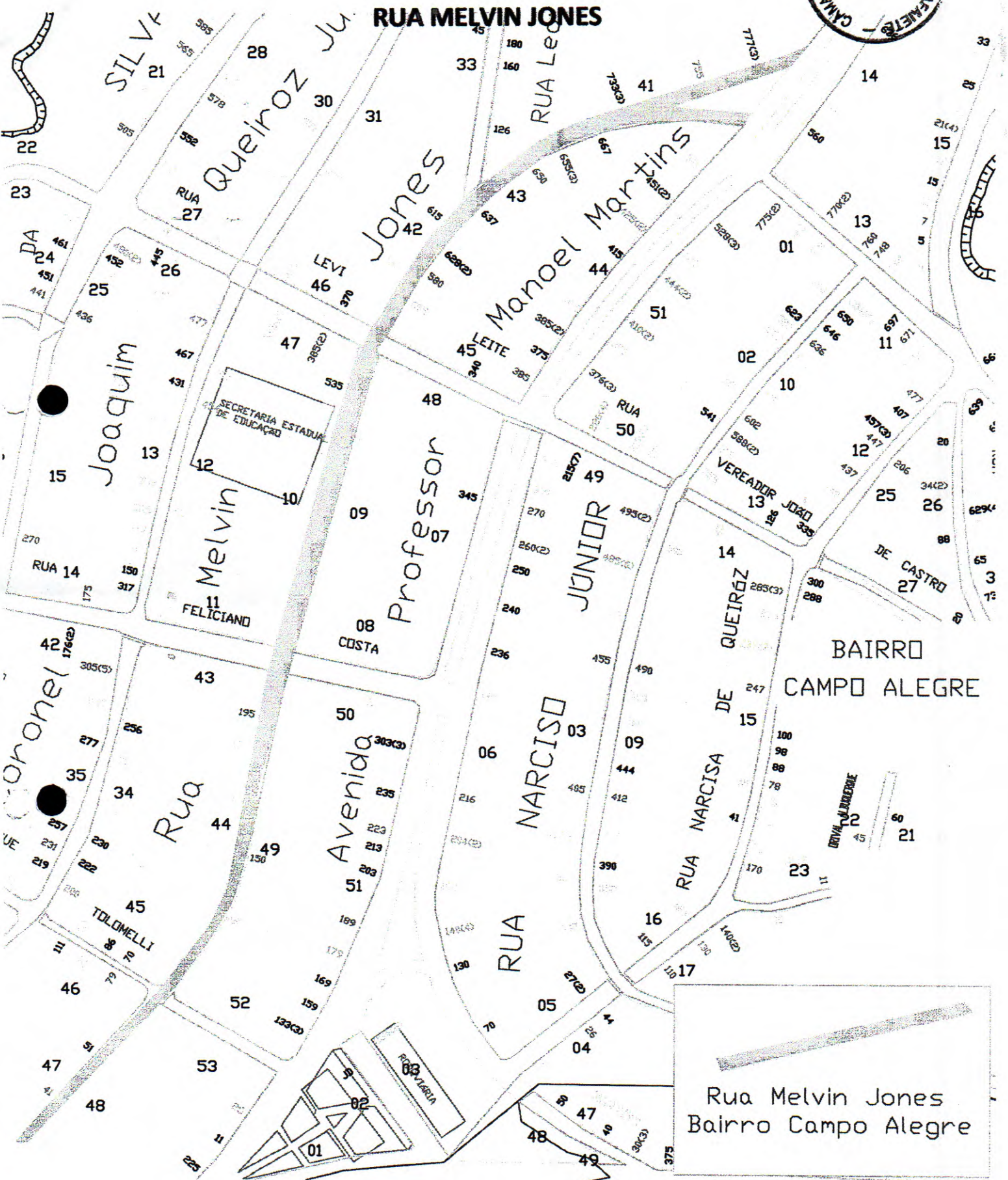
Rua Melvin Jones Bairro Campo Alegre